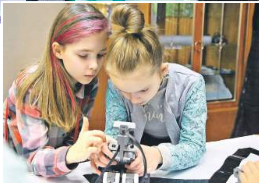
Учащиеся детского объединения «Робототехника» программируют робота

Гранты — это хорошо или плохо? С одной стороны, хорошо: это возможность развиваться, приобретать оборудование, получать новые знания. И почему это может быть плохо? Да потому что грантовый проект должен быть социально значимым и его нужно отработать. То есть не просто деньги получать, но и работать, много работать. Да и заявку на грант или отчёт о его реализации написать не каждый способен. И всё же грантовая поддержка даёт такие огромные возможности, особенно для образовательных учреждений!