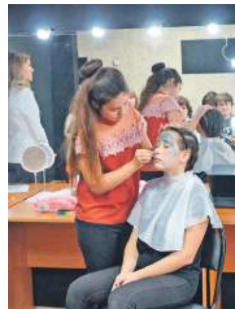
Учащиеся детского объединения «Гримёрка» учатся наносить грим