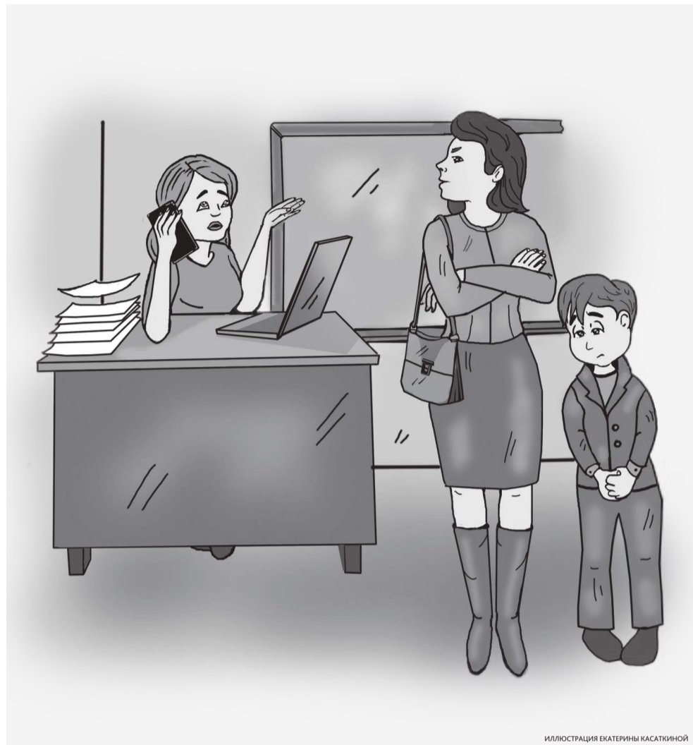
ИЛЛЮСТРАЦИЯ ЕКАТЕРИНЫ КАСАТКИНОЙ

Но тут в течение рабочего дня поступает звонок с ватты: пришла мама одной из учениц, эмоции переполняют, ей срочно нужен директор! Думаю, что же произошло? Понимаю, что лучше решить вопрос сразу на месте, чем заставлять даму ждать и лишний раз раскручивать себя. Срочно вношу изменения в своё расписание, договариваюсь с учителем, у которого «окно», поменяться уроками и приглашаю родителя в кабинет. Выясняется: во время одного из уроков девочка, дочь посетительницы, наобидничала учителю, что её одноклассник пытается списывать из учебника правильные ответы. Этот мальчик в свою