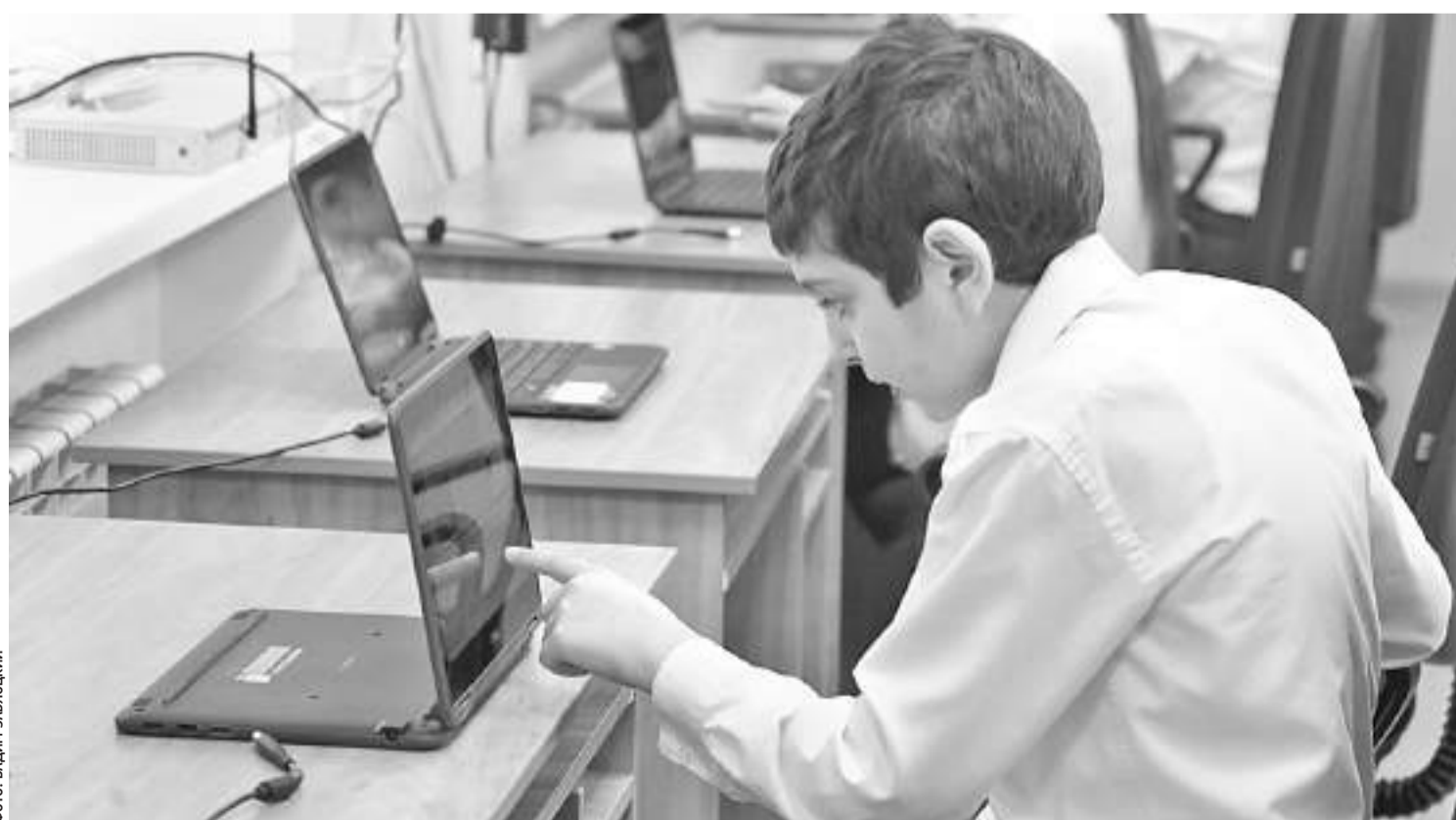
Компьютерное оборудование в Ровеньской школе № 2

Другим механизмом, возникающим на основе «Виртуальной школы», станет Распределённое Оценивание в Системе Талантов (РОСТ). До настоящего времени результаты учеников, полученные вне школьной системы, школой не учитывались и в аттестатах не отражались. Вместе с тем внешкольные занятия формируют у ребёнка большую часть жизненных и предпрофессиональных навыков, приучают к здоровому