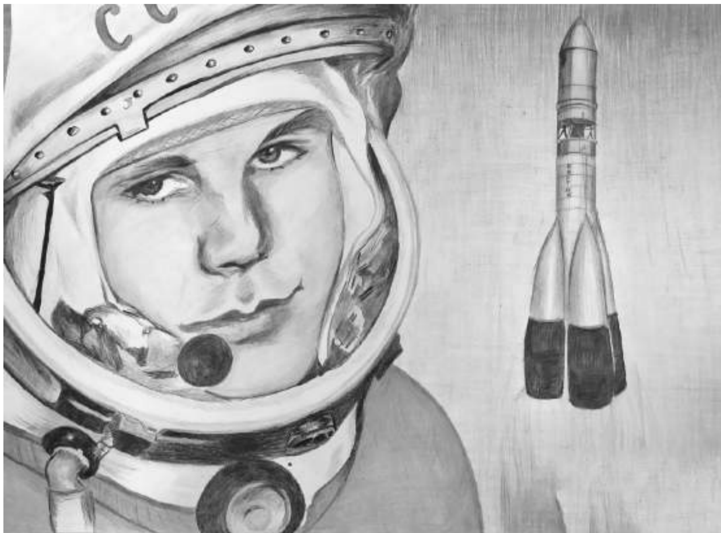
«Он сказал: «Поехали!». Рисунок Юлии Комендантенко (Береговская школа Прохоровского района)

ЗА ЧТО НУЖНО СКАЗАТЬ СПАСИБО ПЕРВОМУ КОСМОНАВТУ ПЛАНЕТЫ