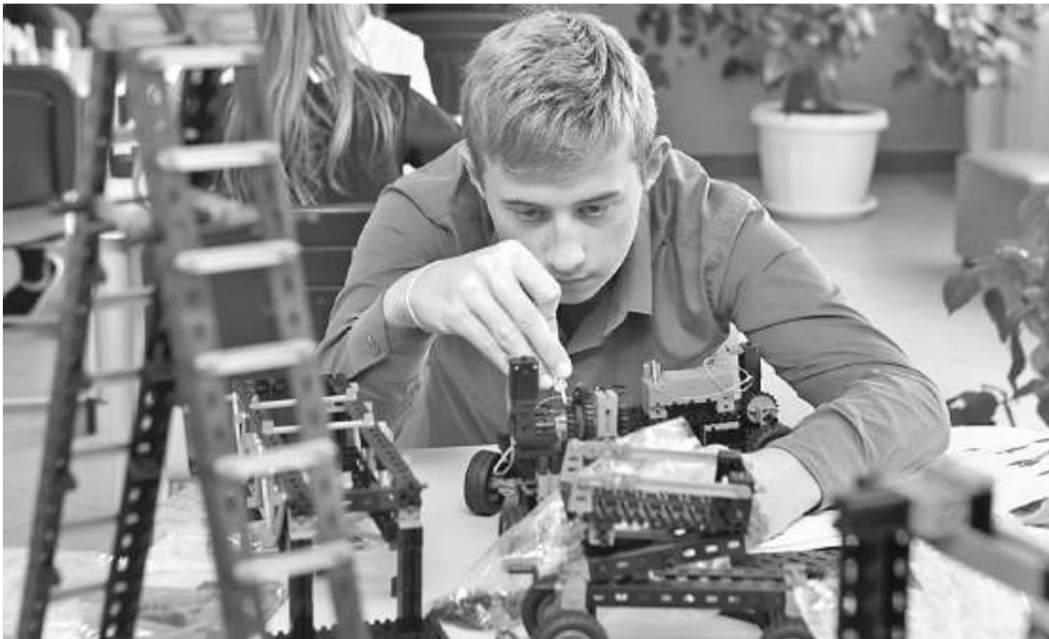
В «Точке роста» Клименковской школы Вейделевского района

образу жизни, обеспечивают гармоничное развитие личности. Требуется разработка единой для всех организаций системы критериев оценивания результатов. Технически, приход на занятие вне школы в организацию, реализующую сертифицированную образовательную программу, учащийся идентифицируется в «Виртуальной школе». В процессе занятий знания, умения, навыки ученика могут быть оценены с внесением данных в систему РОСТ, где такие данные по каждому учащемуся становятся частью его электронной биографии.