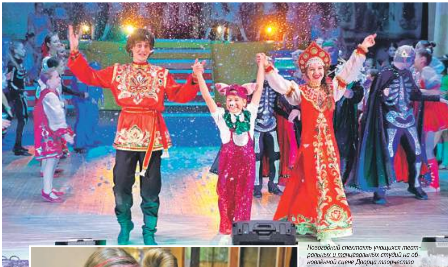
Новогодний спектакль учащихся театральных и танцевальных студий на обновлённой сцене Дворца творчества

ПОЧЕМУ КАЖДЫЙ ГРАНТОВЫЙ ПРОЕКТ В СФЕРЕ ОБРАЗОВАНИЯ ДОЛЖЕН РАЗВИВАТЬСЯ И ПОСЛЕ ОКОНЧАНИЯ СРОКОВ РЕАЛИЗАЦИИ