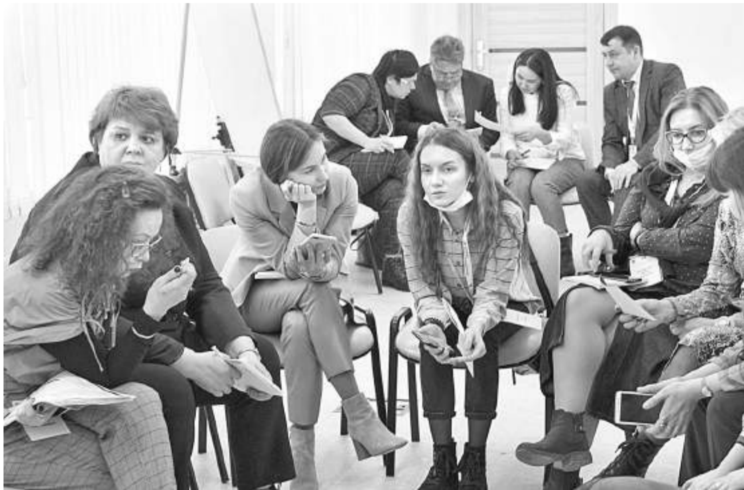
Во время дискуссии

КАК ОПЫТ КОЛЛЕГ ПОБУЖДАЕТ МЫСЛИТЬ И ДЕЙСТВОВАТЬ