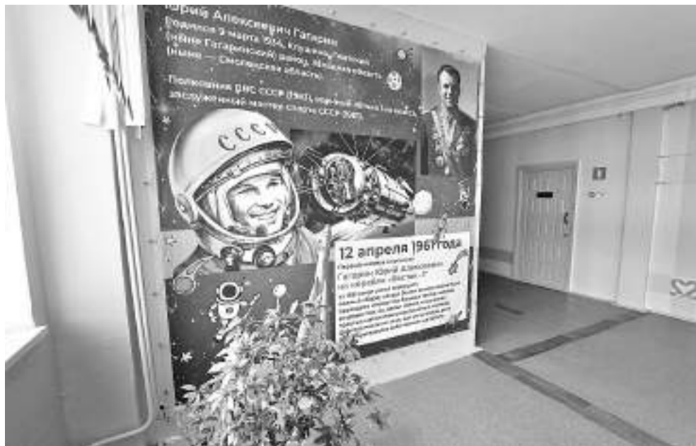
В гимназии № 22 даже стены учат