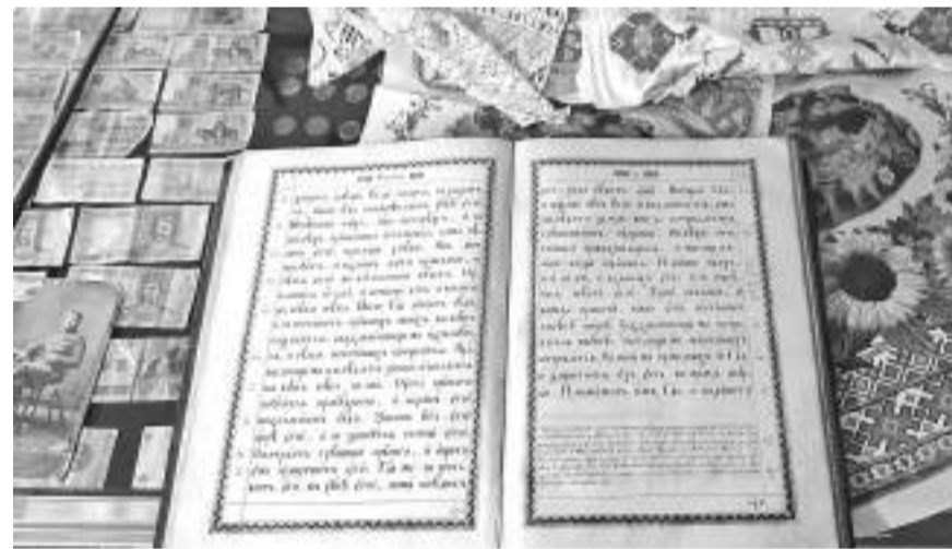
Экспонаты музея Прелестненской школы

ДЛЯ НАШИХ КАДЕТ МЫ РАЗРАБОТАЛИ СВОЙ КУРС ИСТОРИИ, НАЧИНАЯ С ПЕРВОГО КЛАССА. ОН СОДЕРЖИТ В СЕБЕ НЕСКОЛЬКО РАЗДЕЛОВ: ПЕРВЫЙ КЛАСС — ИСТОРИЯ МОЕЙ СЕМЬИ; ВТОРОЙ КЛАСС — ИСТОРИЯ МОЕГО СЕЛА; ТРЕТИЙ КЛАСС — ИСТОРИЯ МОЕГО РАЙОНА; ЧЕТВЁРТЫЙ КЛАСС — ИСТОРИЯ МОЕЙ ОБЛАСТИ. ЭТО НЕ ПРОСТО ЗАНЯТИЯ ЗА ПАРТОЙ — ЭТО АРХЕОЛОГИЧЕСКИЕ ЭКСПЕДИЦИИ, ПОХОДЫ, РАБОТА В ШКОЛЬНОМ МУЗЕЕ.