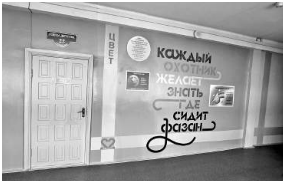
На улице Детства гимназисты могут узнать немало интересных фактов о радуге