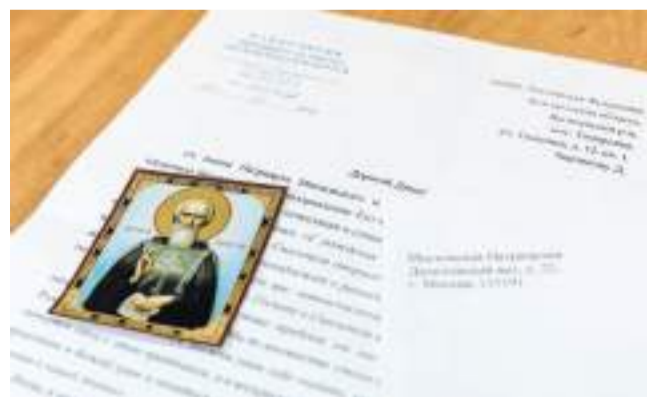
Письмо от патриарха Всея Руси Кирилла

Любовь к английскому не ограничивается только письмами. Дима участвует в олимпиадах: школьных, городских, всероссийских, международных. А ещё они вместе с учительницей создали страницу для электронного журнала Spotlight on Russia , где рассказали о своих письмах.