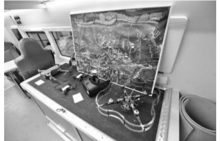
Мобильный «Кванториум» «начинён» современным оборудованием

Планируется, что воспитанники мобильного «Кванториума» будут получать реальные задания от местных предприятий и компа-