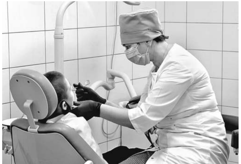
В лечебно-оздоровительном комплексе Корочанской школы-интерната оборудован стоматологический кабинет

Все дети в Корочанской школе-интернате с сохранным интеллектом, так что проблем с их социализацией нет. Но чтобы лучше подготовиться к взрослой жизни, участвуют в проекте «Уроки финансовой грамотности», а в рамках школьной программы на уроках технологии девочки учатся швейному делу (могут они и приготовить несложные блюда: салаты, оладьи, блины...), мальчишки в мастерских — столярному и слесарному. Ученики 10–11-х