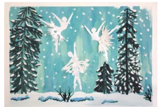
Коллективная работа объединения «Бумажные фантазии»