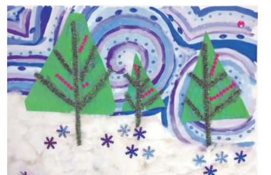
Коллективная работа объединения «Бумажные фантазии»