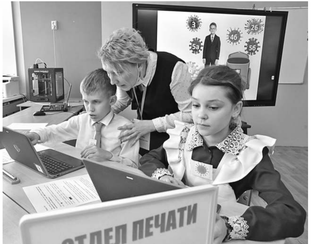
Отделу печати поставлена задача: найти информацию по профилактике коронавируса