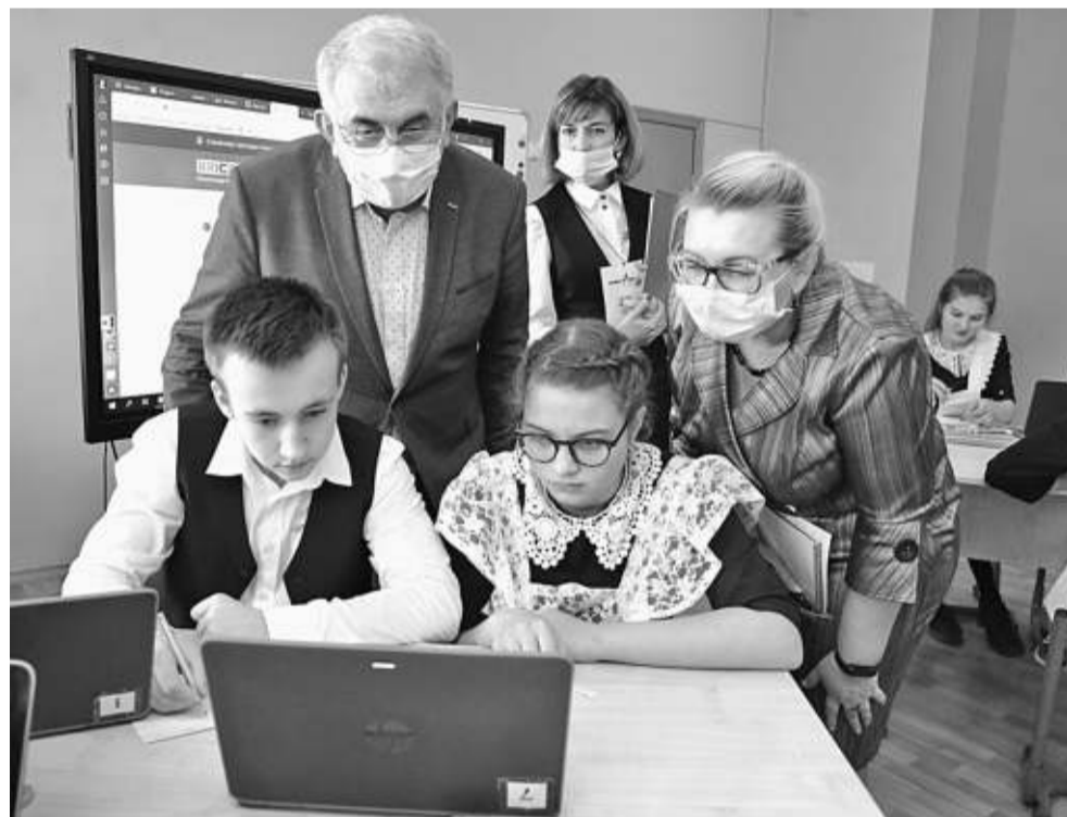
Решать олимпиадные задачи на платформе «Учи.ру» интересно и полезно!