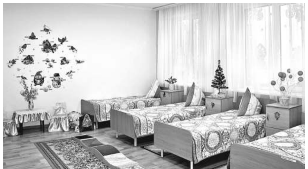
Спальная комната учеников начальных классов

классов ещё учатся в межшкольном учебном центре на водителей категории В.