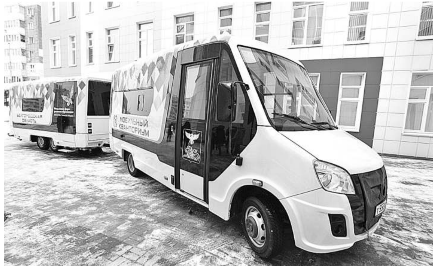
Мобильный технопарк «Кванториум»

КАК МОБИЛЬНЫЙ «КВАНТОРИУМ» ПОМОГ ОХВАТИТЬ ДОПОБРАЗОВАНИЕМ ТЕХНИЧЕСКОЙ НАПРАВЛЕННОСТИ УЧЕНИКОВ СЕЛЬСКИХ ШКОЛ