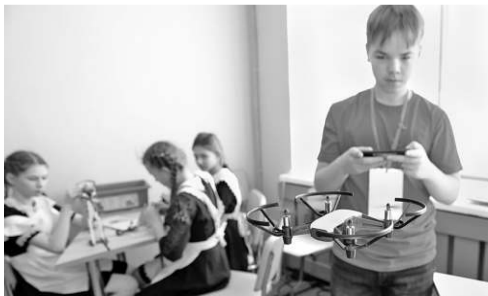
Запуск квадрокоптеров — любимое занятие мальчишек