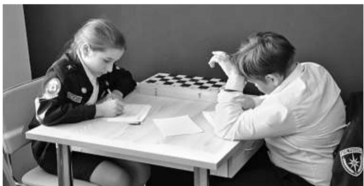
Рассчитать ценность шахматных фигур — задача нелёгкая