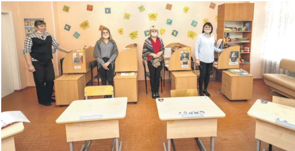
Тьюторы: каждый занимается с одним ребёнком с самыми тяжёлыми проблемами со здоровьем