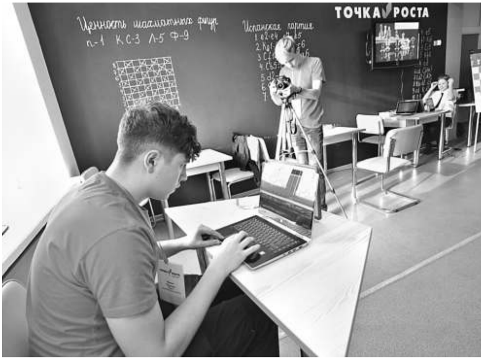
Школьная киностудия «Новое поколение»