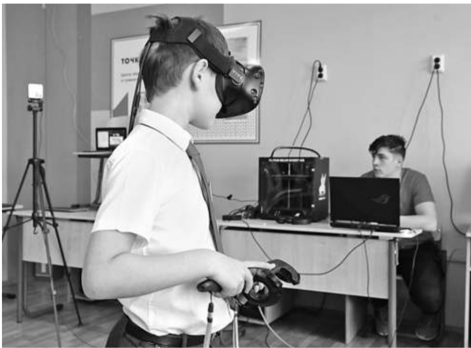
Путешествие вглубь лёгких с помощью очков виртуальной реальности

Старшеклассники Гостищевской школы раз в неделю на математике занимаются на платформе «Учи.ру». На внеурочке этот ресурс тоже активно используется. Нам показали одно из таких занятий: школьники выполняли на ноутбуках задания пробного тура олимпиады Vicsmatch.com+.