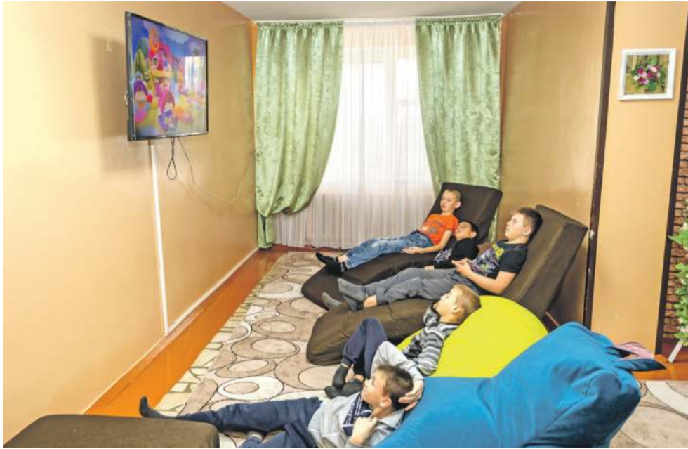
В свободное время можно посмотреть телевизор