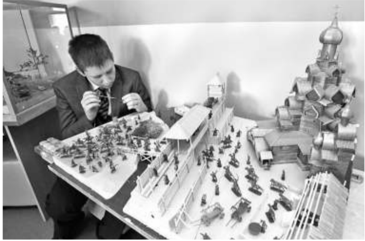
Вот такой макет старинной крепости ребята сделали своими руками