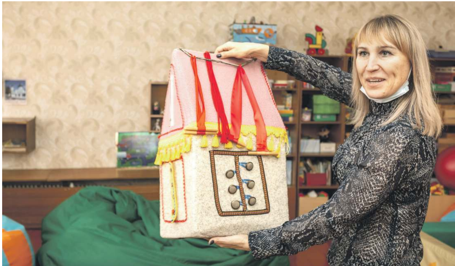
Оборудование для развития мелкой моторики

ПОЧЕМУ В НОВООСКОЛЬСКОЙ ШКОЛЕ-ИНТЕРНАТЕ РЕБЯТАМ ХОРОШО ТАК ЖЕ, КАК ДОМА