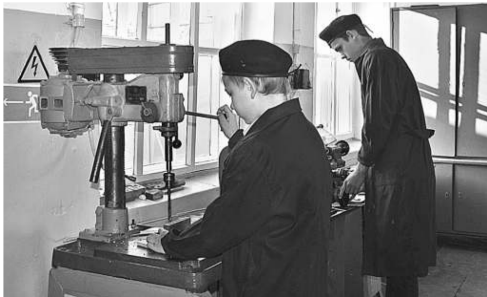
В школьной мастерской мальчишки учатся столярному и слесарному делу