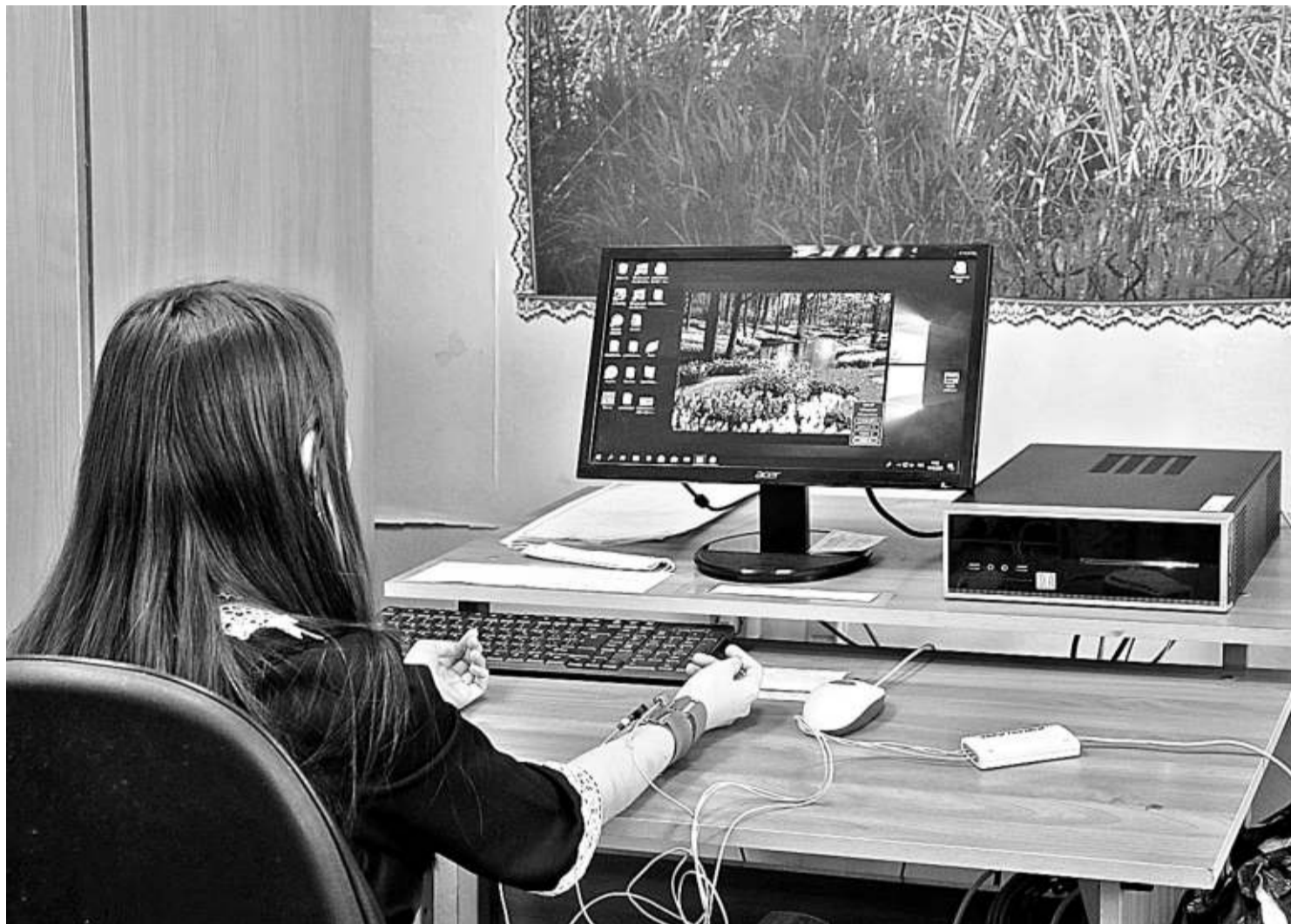
На занятии в кабинете БОС-здоровье

КАК КОРОЧАНСКАЯ ШКОЛА-ИНТЕРНАТ ДАЁТ ПУТЁВКУ В ЖИЗНЬ ДЕТЯМ С НАРУШЕНИЯМИ РЕЧИ