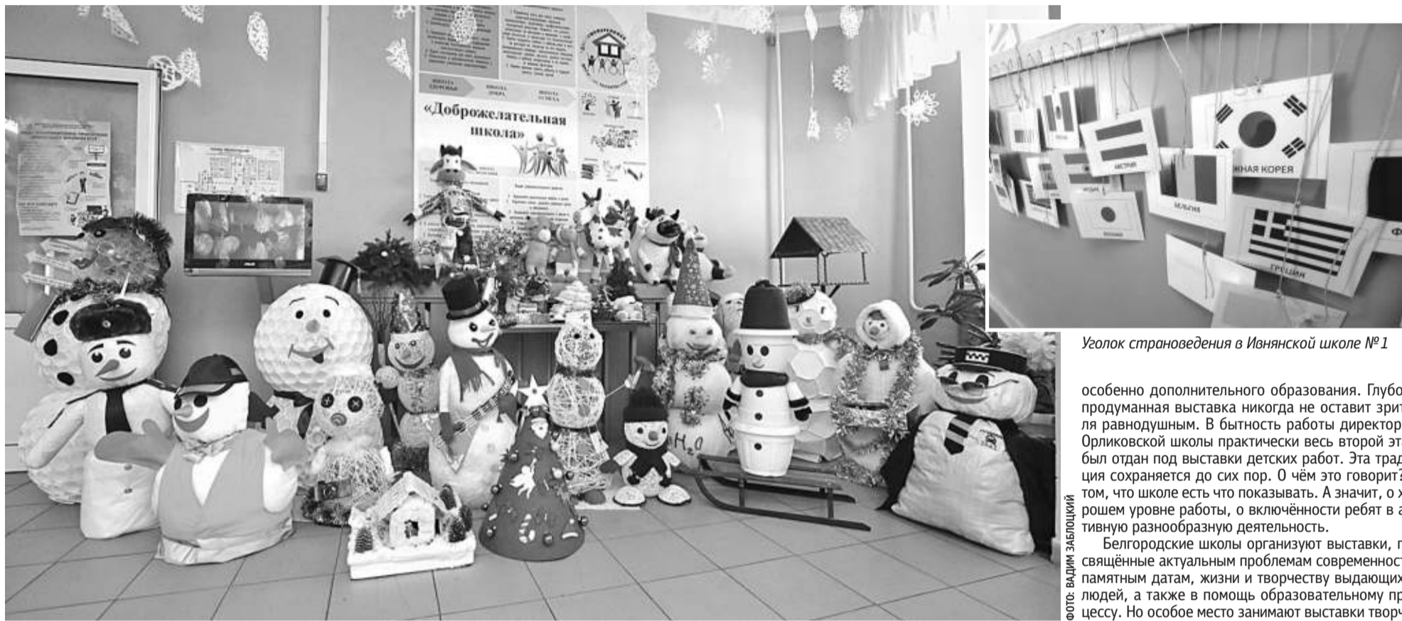
Оформление стен и рекреаций Гостищевской школы Яковлевского округа создаёт новогоднее настроение