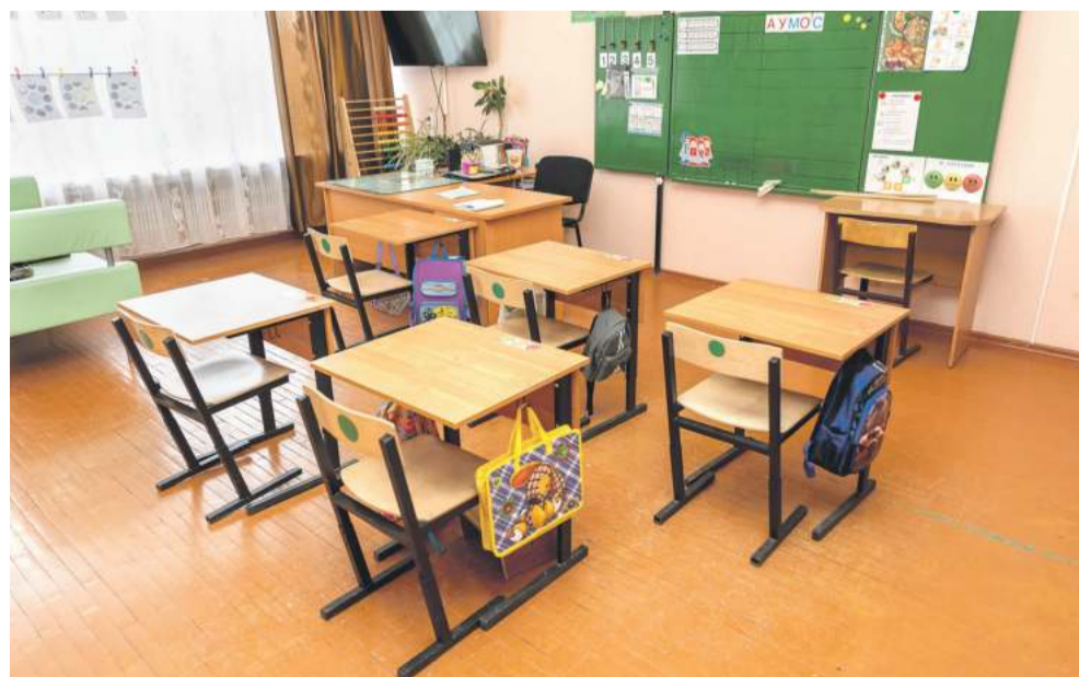
Класс для учеников с тяжёлыми интеллектуальными отклонениями

Слово «социализация» — слишком серьёзное, безликое, официальное. Но означает оно очень многое. Фактически — всю жизнь ребят в школе-интернате. Многие «особенные» дети совсем по-другому