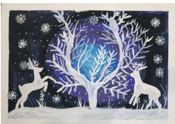
«Зимняя сказка». Рисунок Алексея Чудных (руководитель Дина Кислиця)