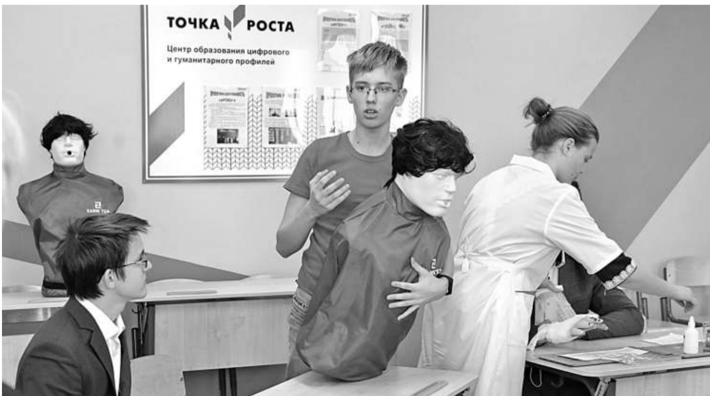
Оказывать первую помощь пострадавшим школьники учатся на манекенах-тренажёрах