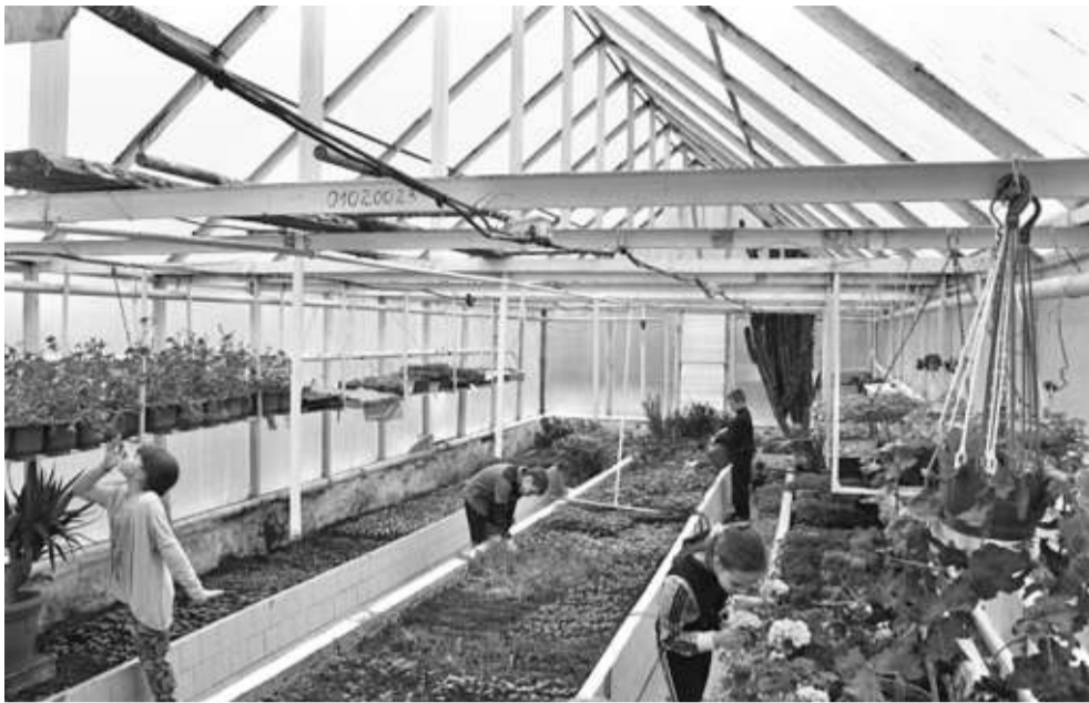
Школа имеет учебно-опытный участок площадью 0,75 га, где выращивают овощи и фрукты. В теплице зимой — зелень, весной — саженцы цветов

класса с современным оборудованием, шесть логопедических кабинетов, комната психологической поддержки, вокальная студия, спортивные и игровые площадки.