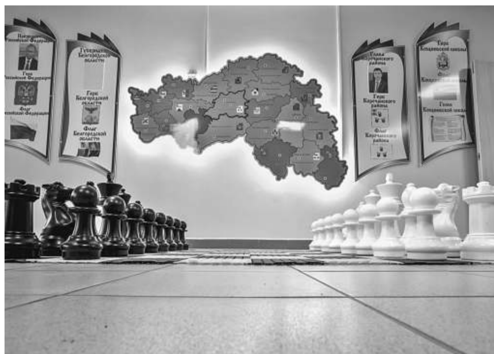
Оформление стен в Коцеевской школе Корочанского района