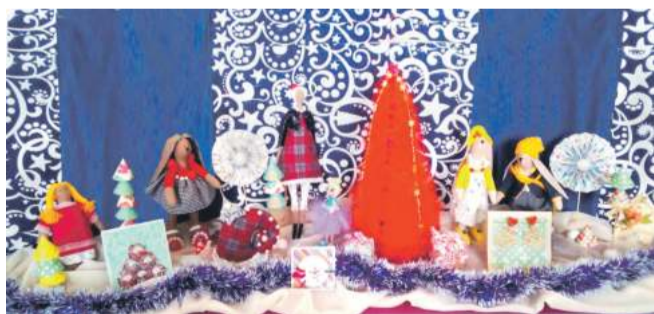
Подделки ребят из объединения «Умелые ручки»