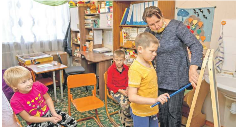
Творческие занятия на внеурочке