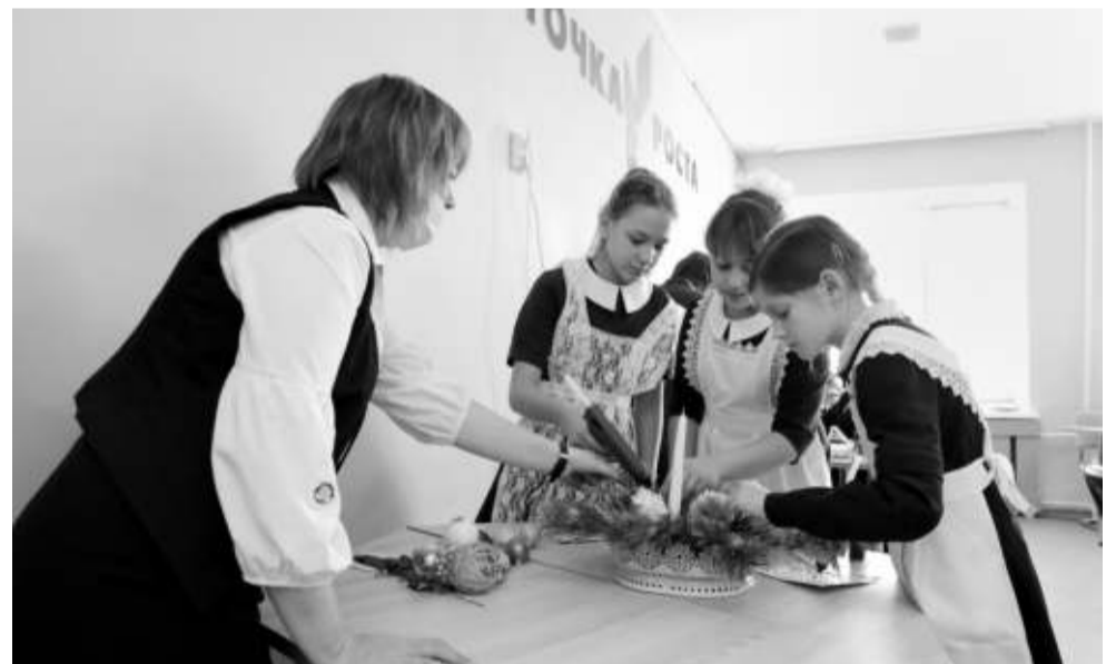
Девчонки из кружка «Станем волшебниками» за несколько минут создали новогоднюю композицию