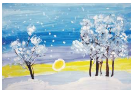
«Снег». Рисунок Юрия Кривокустава (руководитель Дина Кислиця)