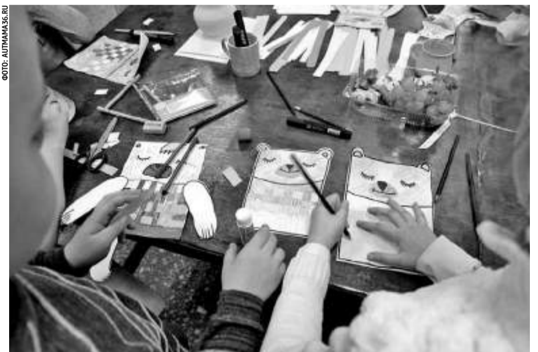
Мастерские для детей-аутистов в Воронеже

долгосрочной перспективе здесь намерены сделать глиняные поделки источником заработка для своих особенных детей. Вопросы распространения воронежского опыта по применению гончарного дела в районах и городских округах Белгородской области будут курировать заместители глав органов местного самоуправления по социальным вопросам.