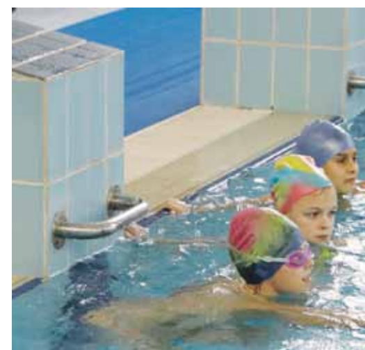
Ученики школы № 2 занимаются в бассейне ФОКа