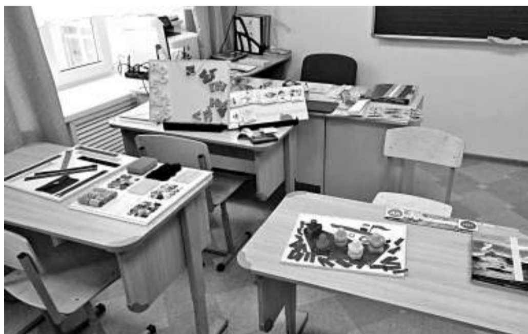
В творческой мастерской для детей с РАС

гружение работников в проблему, их изменившееся мышление и сознание. Специалисты не пытались создать видимость благополучия, а открыто говорили о трудностях, размышляли, рассказывали о поиске оптимальных методов и подходов.