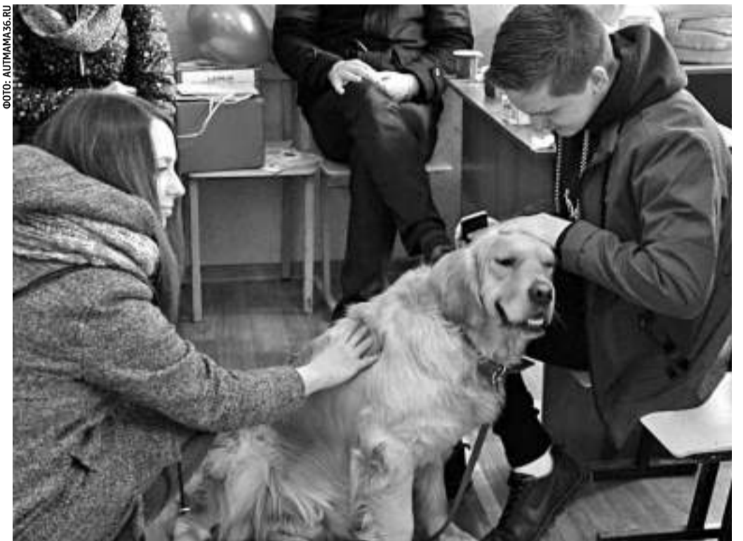
По инициативе воронежской организации «АутМама» используется канистерапия — лечение через общение с собаками

В работе с детьми с РАС в Воронеже активно применяют гончарное дело, для этого в школах создали гончарные мастерские. Через глину дети с РАС привывают друг к другу. Лепка развивает не только мелкую моторику, но и абстрактное мышление, которого у детей с РАС практически нет. В