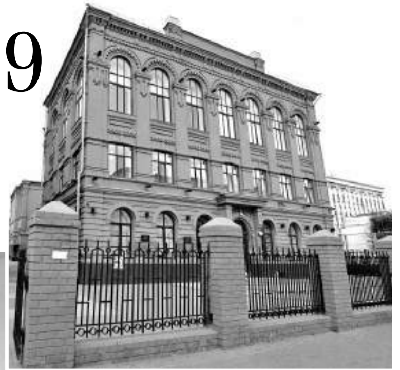
Лицей № 9

— Использование картирования позволило выявить проблемные места в образовательной деятельности и проанализировать возможности их устранения. Сейчас в лицее разработан 21 бережливый проект, шесть из которых уже реализованы.