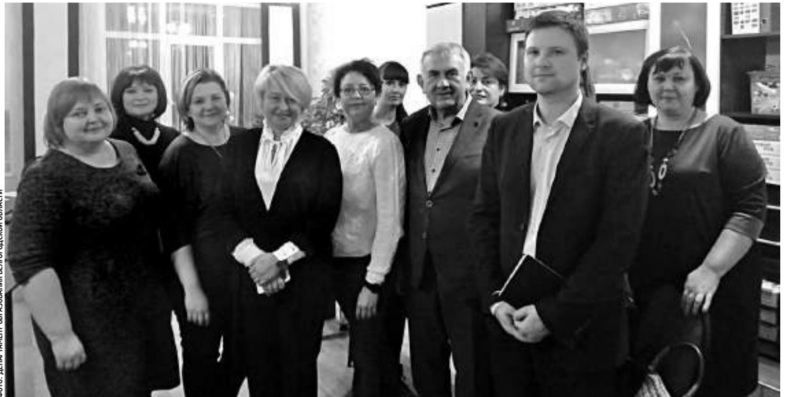
Белгородская делегация в гостях у воронежских коллег

Так же, как и в Белгородской области, в Воронежской действуют различные фонды, региональ-