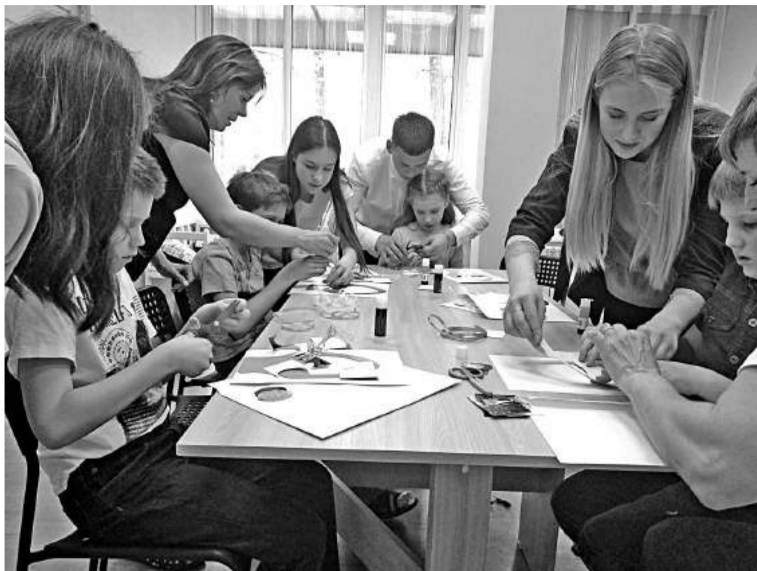
Воронежские волонтеры проводят занятия с подопечными «АутМамы»

ОБ ОПЫТЕ ВОРОНЕЖСКОЙ ОБЛАСТИ В РАБОТЕ С ДЕТЬМИ С РАС