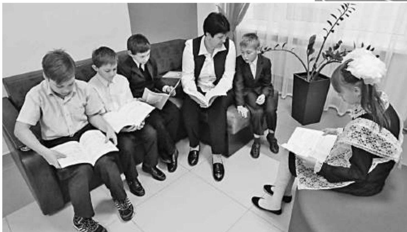
Зоны тихого отдыха в Вязовской школе Краснояружского района