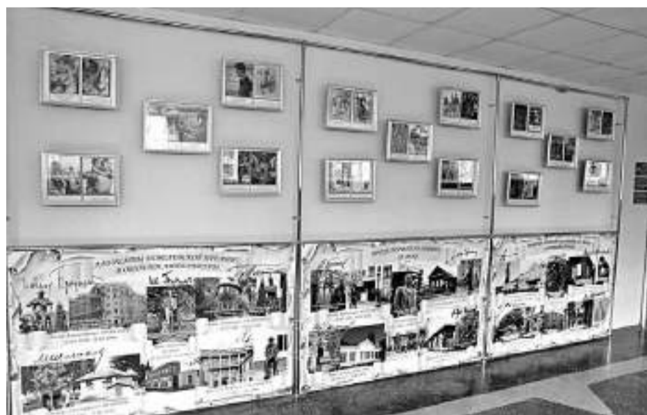
Образовательная зона лицейского литературного музея

На классных часах учителя рассказывают школьникам о способах применения бережливых инструментов на личном рабочем месте. Для