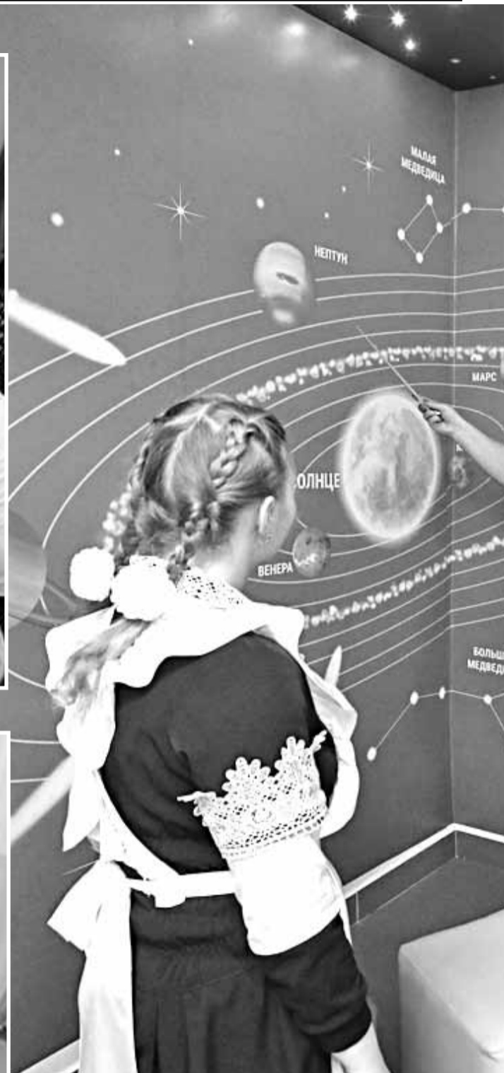
Астрономический уголок в Вязовской школе Краснояружского района

Сегодня каждой школе законом разрешено самостоятельно осуществлять деятельность, разрабатывать и принимать локальные нормативные акты, содержащие нормы, регулирующие образовательные отношения. Отношение к принятию локальных нормативных актов должно меняться, оно должно быть заинтересованным со стороны не только педагогов, но и родителей. Не будем забывать, что родители — это равноправные участники образовательных отношений. Расписание — это такой же локальный нормативный акт. И если родители пренебрегли своим правом на участие в его обсуждении, а потом, когда расписание утвердили, стали упорно доказывать, что оно им не подходит, то это неправильно. Тем более что нелинейное расписание имеет право на существование. Главный довод в его пользу — это разнообразие занятий, а следовательно, условие сохранения здоровья и достижение необходимых результатов. Очень мудро поступили в Краснояружской школе № 1, согласовав расписание с каждым родителем. Нужно уметь договариваться. Убеждён, что нет нерешаемых вопросов.