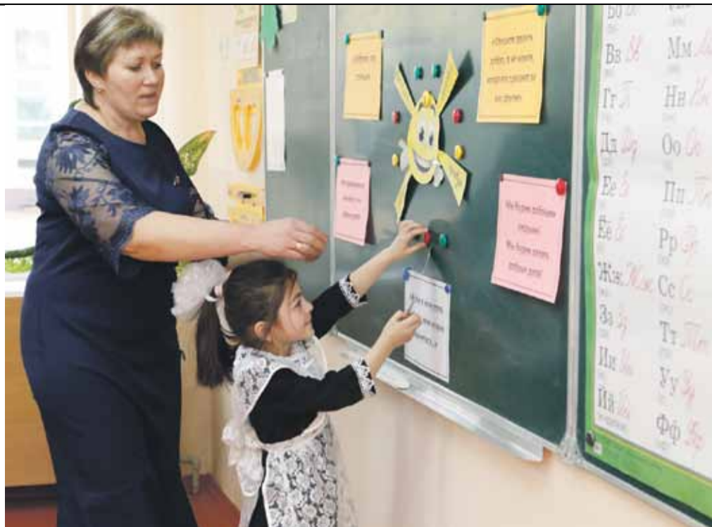
Урок в начальной школе села Степное