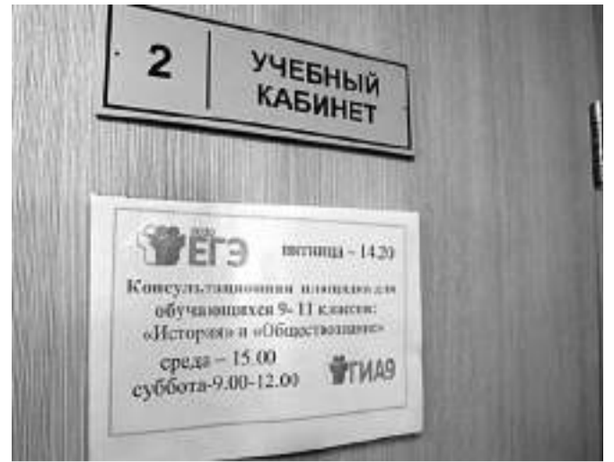
Консультационные площадки в Краснояружской школе № 2