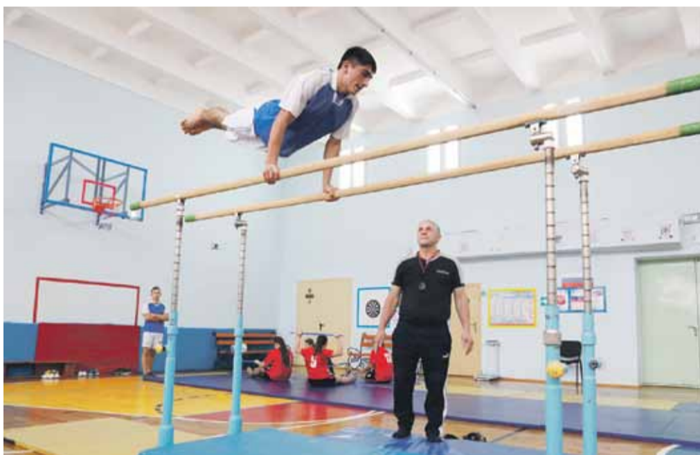
На внеурочных занятиях по спортивной подготовке в Степнянской школе