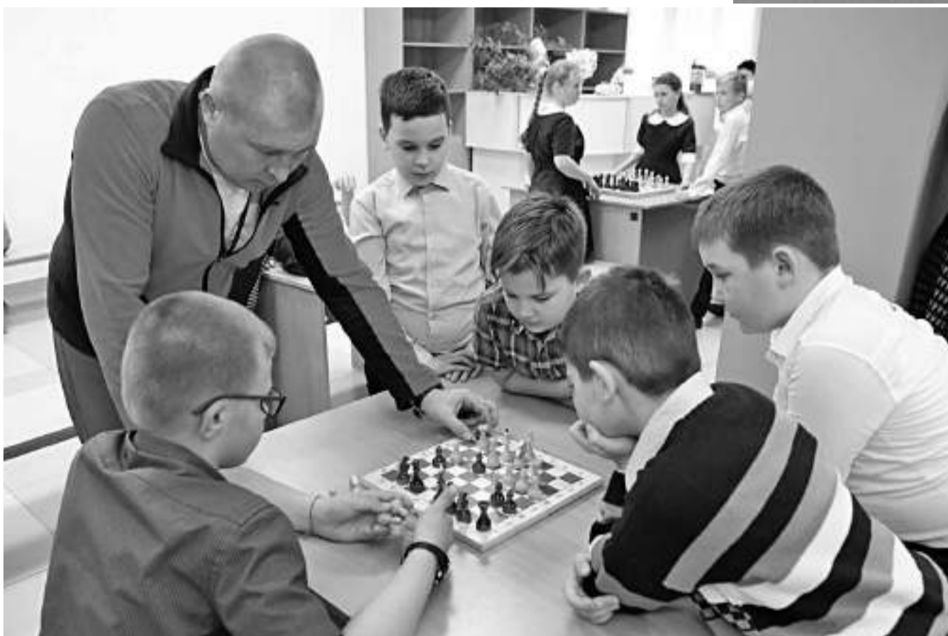
Шахматные перемены в Краснояружской школе № 2