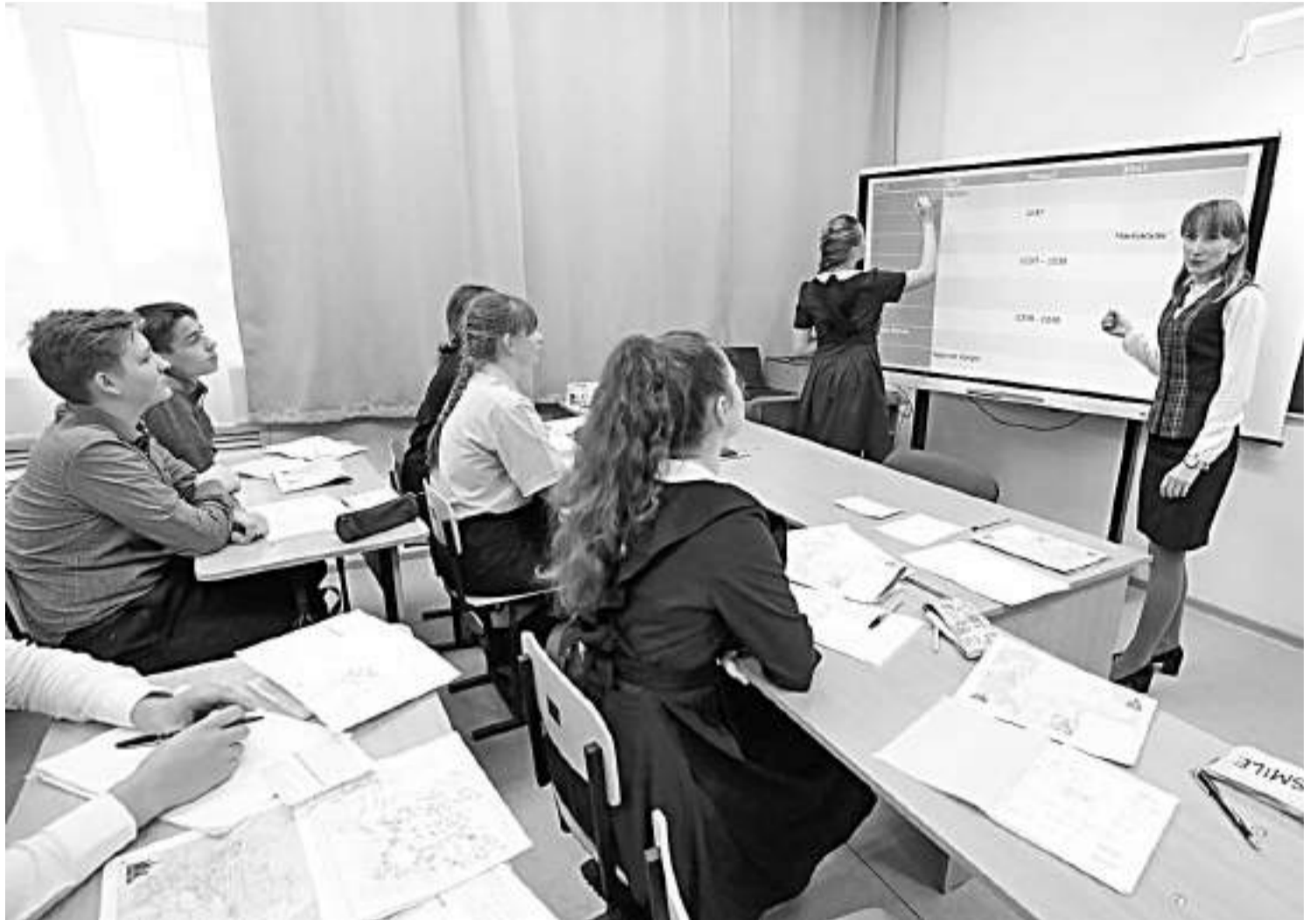
Несколько смарт-досок для школ района приобрели в рамках нацпроекта «Образование»

Почему только час? Потому что расписание очень насыщенное. И учебными делами детям нужно заниматься дозированно, иначе проку никакого не бу-