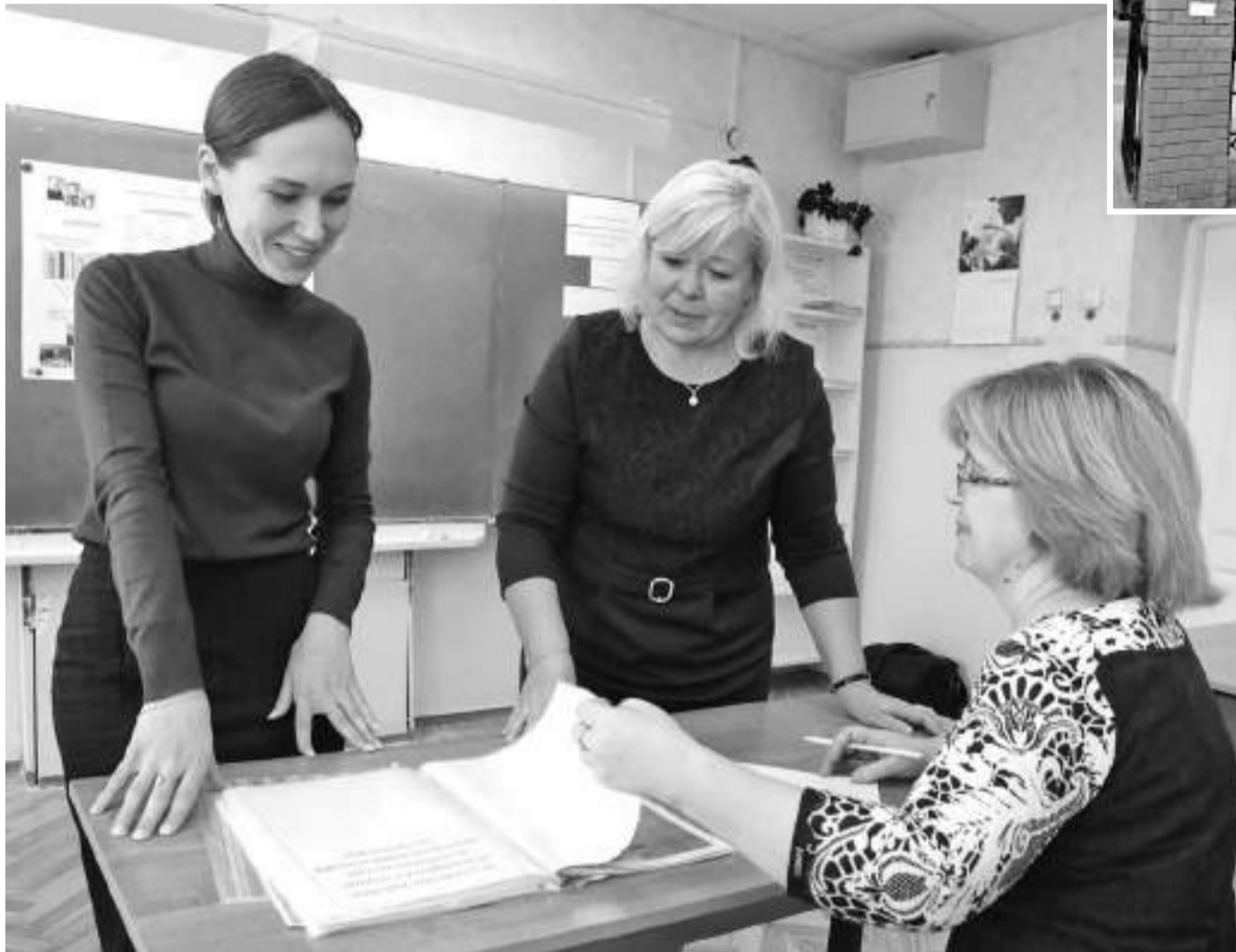
Работа с наставником