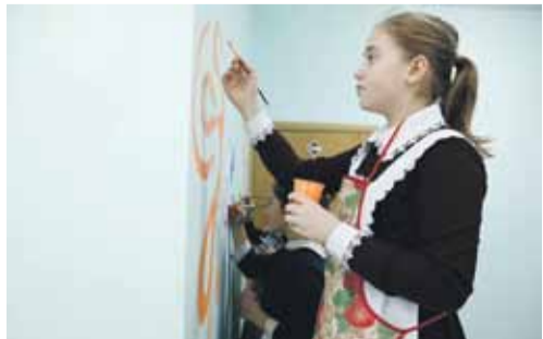
Ученики Степнянской школы сами разукрашивают стены