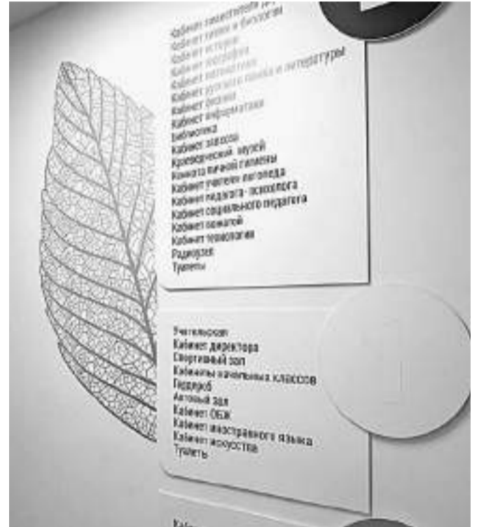
Элементы бережливых технологий в Краснояружской школе № 2