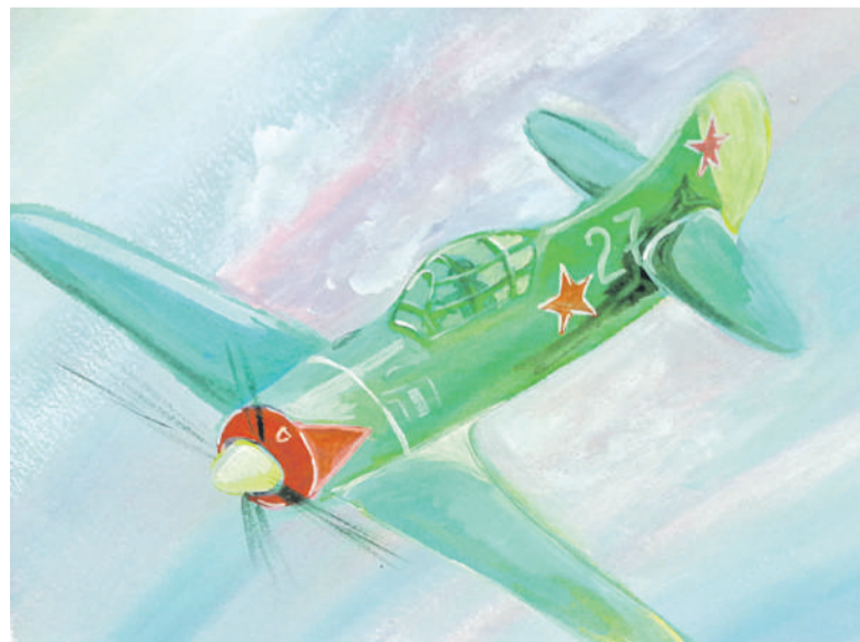
Воздушный бой. Рисунок Дмитрия Новикова (Корочанская школа им. Д. Кромского)