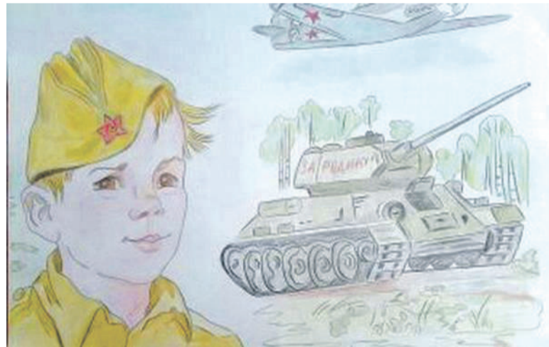
Рисунок Дарьи Лопиной (Корочанская школа им. Д. Кромского)