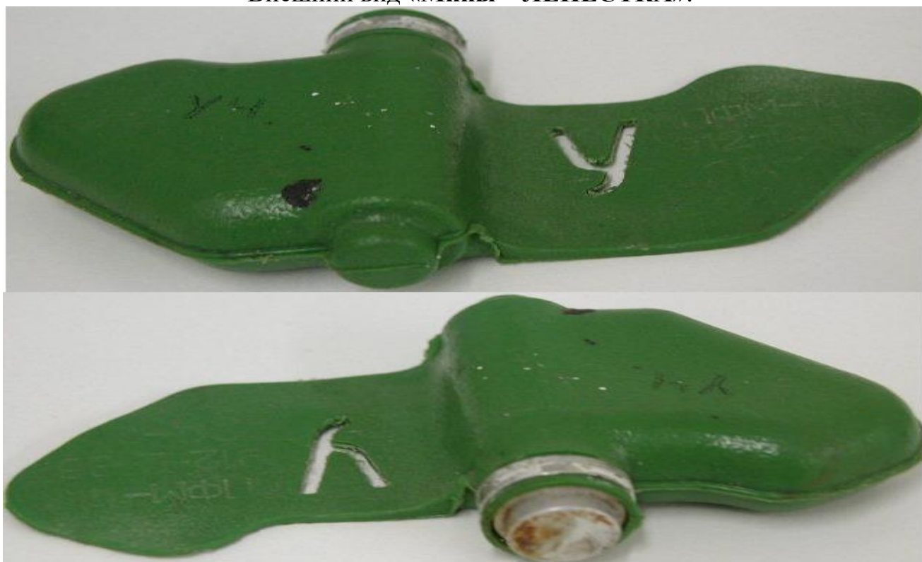
Внешний вид « Ми́ны – ЛЕПЕСТКА »:

Масса мины 80 грамм, размеры – 12 x 6 сантиметров, чувствительность мины лежит в пределах 5-25 кг, что вполне достаточно для срабатывания от веса маленького ребенка.